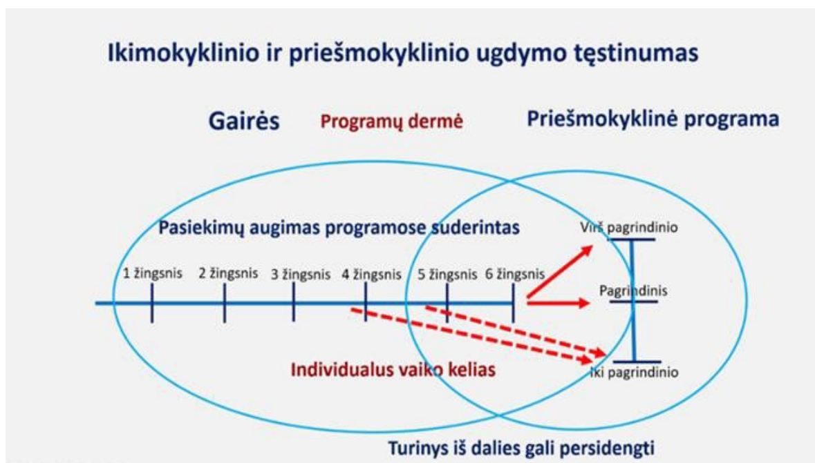
3 pav. Ikimokyklinio ir priešmokyklinio ugdymo programų dermė

Ikimokyklinio ir priešmokyklinio ugdymo(si) dermė ir tęstinumas. Vaikų ugdymo(si) dermę ir tęstinumą užtikrina Ikimokyklinio ugdymo ir Priešmokyklinio ugdymo programos svarbiausių ugdymo(si) principų atitiktis ir ugdymo(si) proceso kryptingumas – ugdymo(si) modeliavimas iš vaiko raidos ir ugdymosi perspektyvos, išskirtinis dėmesys žaidimo pedagogikai ir patirtiniam vaikų ugdymui(si). Taip pat ikimokyklinio ir priešmokyklinio ugdymo(si) tęstinumą užtikrina ikimokyklinio ugdymo(si) laikotarpiu plėtojamų pasiekimų sričių ir priešmokyklinio ugdymo(si) laikotarpiu plėtojamų kompetencijų dermė: suderintos jas sudarančių pasiekimų grupės, pasiekimų turinys, jų augimo nuoseklumas.